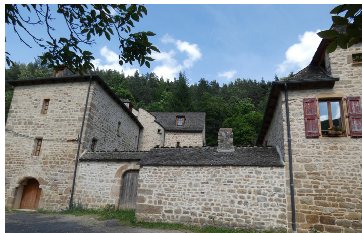
Manoir du vallon de Rieucros