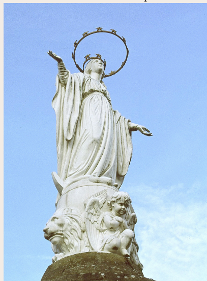
La Vierge du Bédât