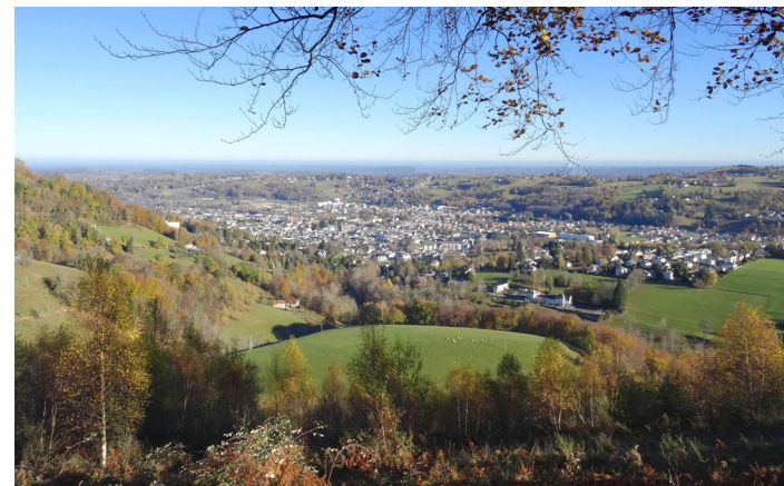
Vue sur Bagnères-de-Bigorre