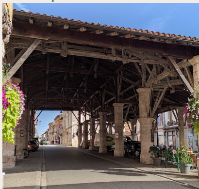
La halle de Gimont

charpente en chêne couvre quelque 1 000 mètres carrés avec un toit en tuiles canal à 4 pentes.