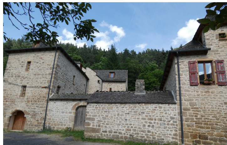
Manoir du vallon de Rieucros